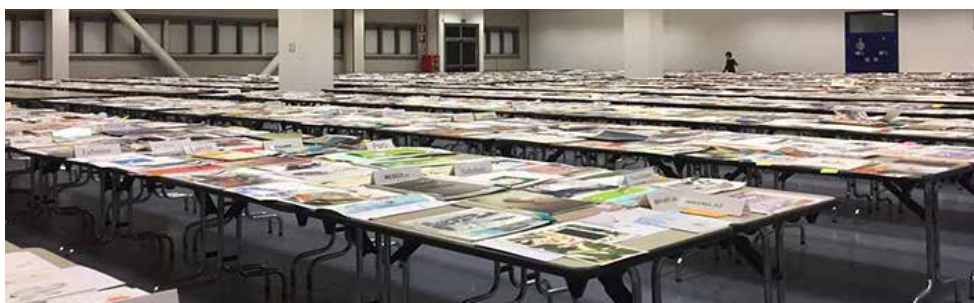
Salón donde el jurado revisaba los más de 15 mil trabajos de 3,053 participantes

Como en cualquier otra profesión o quehacer, aunque en este tiene que ver mucho la creati-